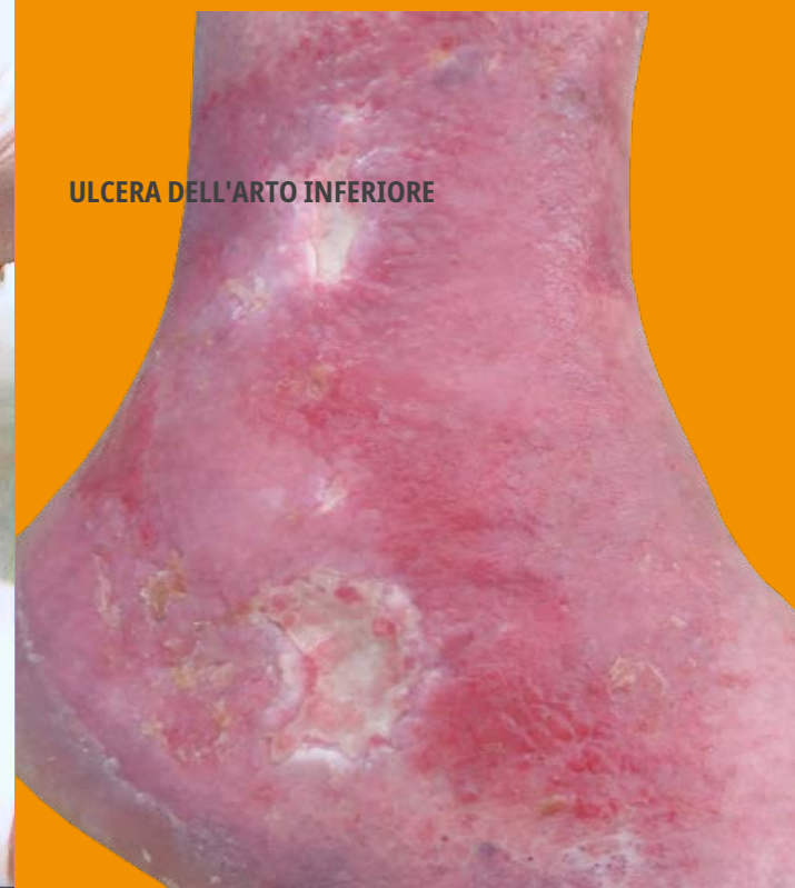
ULCERA DELL'ARTO INFERIORE