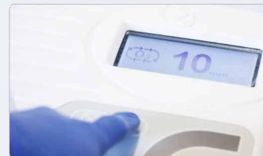
3. Touch Regolazione tempo