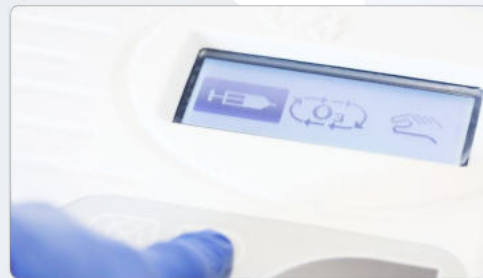
Touch Modalità Siringa