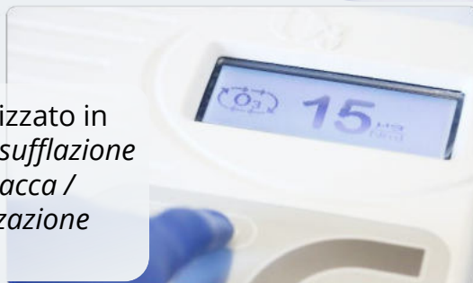
1. Touch Concentrazione