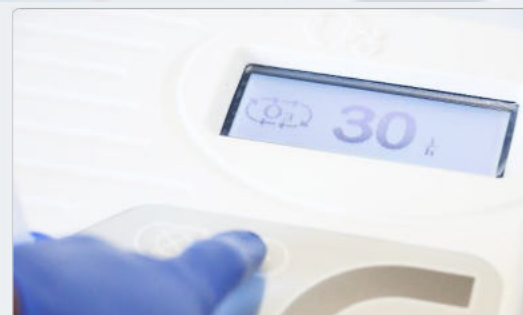
2. Touch Regolazione Portata